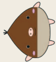
図書館キャラクター「くりぶー」