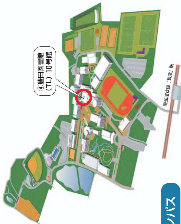
④豊田図書館 (TL) 10号館