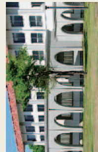
③法学文献センター