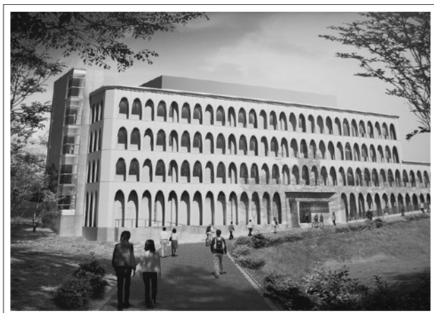
付属新棟の完成予想図