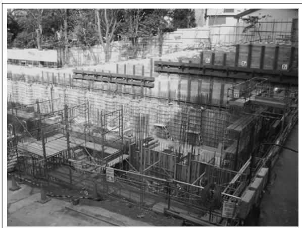
建設中の図書館付属新棟