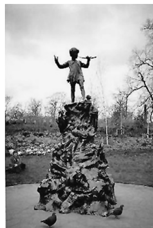
ピーター・パン像