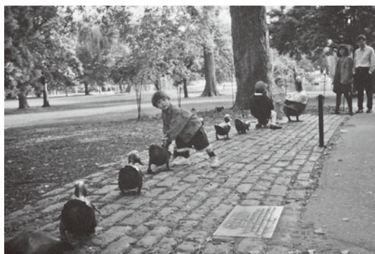
ボストンコモン カモの塑像

訪れるたびに出かけたのが、ボストンコモンであった。自然ゆたかな美しい公園で、林の小径を辿って