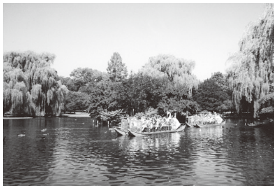
ボストンコモンの池 中央 カモの住んだ〈中の島〉

事実、中の島にはカモたちが住んだという記念の表示板があって、島の周りを遊覧船がまわり、多くの親子が短い船旅をたのしんでいた。それは、私にとって思いがけない光景であった。