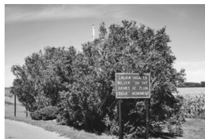
『プラム・クリークの土手で』のモニュメント

9月1日朝、パートさんの車でミネアポリスを発ったが、郊外に出ると、背高のコーン畑が延々とつづく。ミネソタはもうすっかり秋であった。コーン畑を過ぎると、草原が開け、はるかむこうに地平線が見えた。1時間ばかり走って、草原の切れたところに、「ローラ・インガルス・ワイルダー『プラム・クリークの土手で』モニュメント」と記された表示板があり、これがウォルトナット・グローブ村の入口であった。