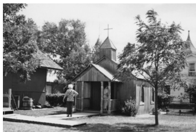
ローラが通った教会

村内には、ローラの通った〈ワン・ルーム小学校〉があり、机が12ほどあって、前の机には、LAURAと自筆で記した石板が机の上に置いてあった。学校の傍らにはカンザスからミネソタまでの遠い道りを走ってきた古い幌馬車が見られた。村にはちいさな教会があり、そのむこうに、水が澄み、さささわと囁いている流れがあり、ちいさなクリークがあった。